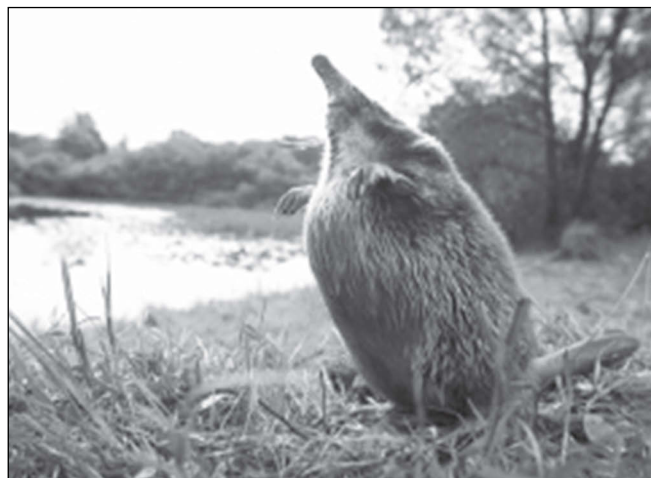
Русская выхухоль с ее хоботком и лапами и земноводным образом жизни долго сопротивлялась классификационным усилиям натуралистов.

таты таких категоризаций, конечно, усложняют картину, но не меняют ее принципиальным образом, поскольку категоризация мира в целом осуществляется в тех же головах (в данном случае – людских), что и категоризация человеческих коллективов и подчиняется тем же закономерностям и прихотям. На это обстоятельство обратили внимание еще Э. Дюркгейм и М. Мосс, которые в своей работе «О некоторых первобытных формах классификации», опубликованной более века назад, предложили концепцию, в соответствии с которой классификация вещей, по крайней мере в первобытных обществах, повторяет и воспроизводит классификацию людей: «Если тотемизм является в определенном отношении объединением людей в кланы в соответствии с природными объектами (ассоциированными видами тотемов), он выступает и наоборот – как группировка естественных объектов в соответствии с социальными группами» 68 . Рассмотрение языка и культуры как аппаратов , т. е. устройств, в определенных отношениях программирующих поведение людей, в рамках рассматриваемой здесь темы оказывается продуктивным, поскольку заставляет по-новому взглянуть на концептуализацию управления в социально, культурно и политически неоднородных обществах, на возможности и ограничения управления языковыми и культурными процессами, затрагиваемыми (если не формируемыми) и существенные характеристики самих практик администрирования.